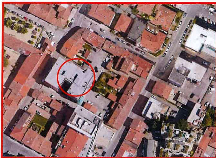
Campi Bisenzio – Via Fausto Sestini, 20